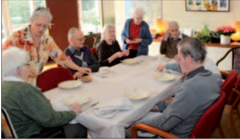
Beth Shamar houdt a.s. zaterdag open dag.

Op dit moment is er in de gemeente de Bilt geen mogelijkheid voor dagverzorging of dagopvang voor ouderen op zaterdag. Verschillende cliënten en hun mantelzorgers die deelnemen aan het programma binnen Beth Shamar hebben aangegeven heel graag gebruik te maken van de mogelijkheid voor dagverzorging op zaterdag. Er zal op zaterdag worden gestart met vier deelnemers, die ook op andere dagen het centrum bezoeken. Om de groep intiem en kleinschalig te houden kan er nog met drie deelnemers worden uitgebreid op zaterdag. Voor andere dagen is aanmelding nog mogelijk.